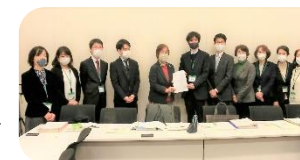
厚労省に介護保険の要望書を提出

●東京都へ予算提案を提出するとともに、プロジェクトを立上げ、21年度からの介護保険制度の改定に向け国に要望書を提出しました。