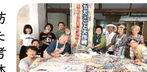
町田・ワーカーズまちの縁がわ小山田桜台

●新型コロナウイルス感染防止対応のため延期されていた2019年度第2回助成の選考を2020年度に行い、2団体に367万円を、2020年度分は2団体に455万円を助成しました。