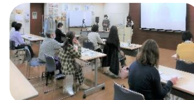
出前講座:世田谷地域協議会

●安心ネットワーク構想連絡会では豊島、町田、日野地域協議会の活動報告および参加地域の現状報告を行った。ブロックおよび地域協議会から51人が参加し、各地域協議会の取り組みについて情報共有することができました。