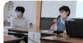
出前講座:多摩南生活クラブ