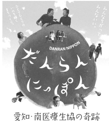
愛知・南医療生協の奇跡

1959年の伊勢湾台風で多数の犠牲者を出したことをきっかけに発足した、名古屋市南区の南医療生協。6万人にも及ぶ会員たちの自由な意見交換によって、活気あふれる運営を行っている組織の姿を通して、現代における地域社会のあり方を模索するドキュメンタリー映画。監督は「いのちの作法」「葦牙(あしかび)こどもが拓く未来」の小池征人さんです。