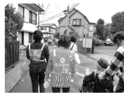
過去の訓練の様子

内容(予定)：・認知症ミニ講座「認知症の方との対話」 認知症について理解し、街で出会ったらどのような対応が望ましいかを寸劇を通して学びます。 ・認知症 SOS ネットワーク模擬訓練 グループに分かれ、街に出て行方不明者の捜索と声かけ・対話を実践します。